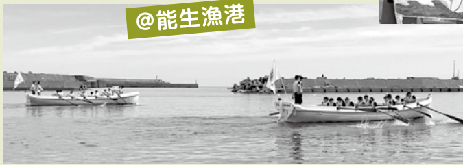
カッターボートをみんなで力をあわせて漕ぎます